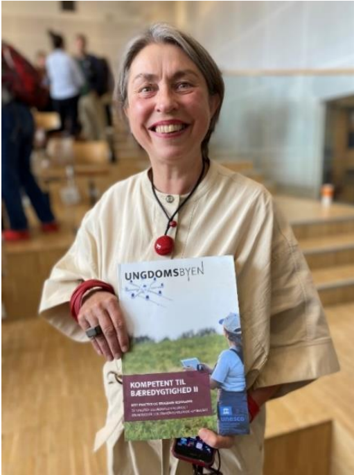
Foto: Elsebeth Gerner Nielsen fra den danske UNESCO National kommission viser Ungdomsbyens nyeste katalog frem.

samarbejde med Tietgenfonden og Hotel & Restaurantskolen, som også skrev om os. Målet er opnået.